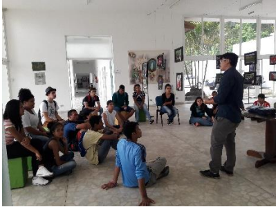
SECRETARIA DE TURISMO