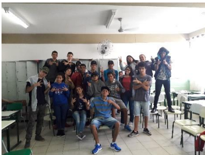
PRODUÇÃO DE TEXTO – HIPHOP