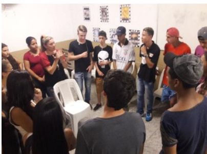
DINÂMICA DE GRUPO