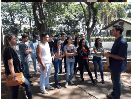
PRODUÇÃO DE TEXTO