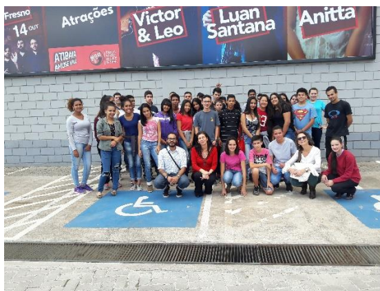
OUTLET FERNÃO DIAS