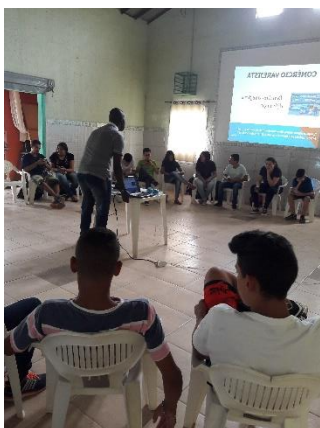
AULAS DE COMÉRCIO VAREJISTA E VENDAS