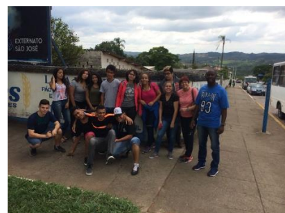
ROTEIRO HISTÓRICO E CULTURAL