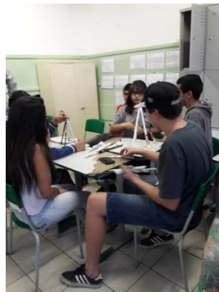
TRABALHO EM EQUIPE