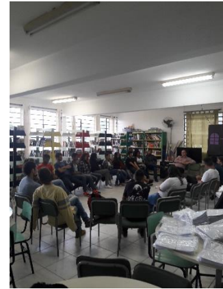
DINÂMICA DE GRUPO