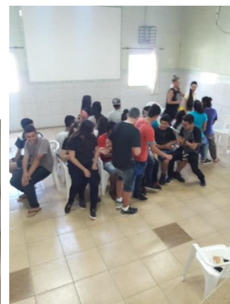
DINÂMICA DE GRUPO

Percebemos os resultados alcançados pelo projeto na conduta e na aparência dos adolescentes que, convivendo em um ambiente que reproduz a cultura empresarial, corporativa, passaram a corresponder às demandas do mercado de trabalho, assim que compreenderam seu papel. Os adolescentes ficaram mais seguros ao se sentirem respaldados em suas necessidades, sonhos e desejos. Ver suas questões pessoais em eco no grupo, na comunidade, no mundo, refletiu nas relações interpessoais, que passaram a ser pautadas pelo respeito e cuidado consigo, com o outro e por atitudes mais colaborativas. Refletiu-