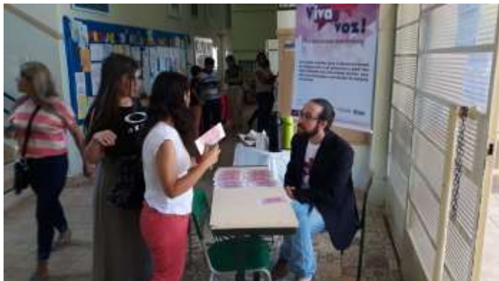
AÇÃO 3: Roda de conversa com os pais