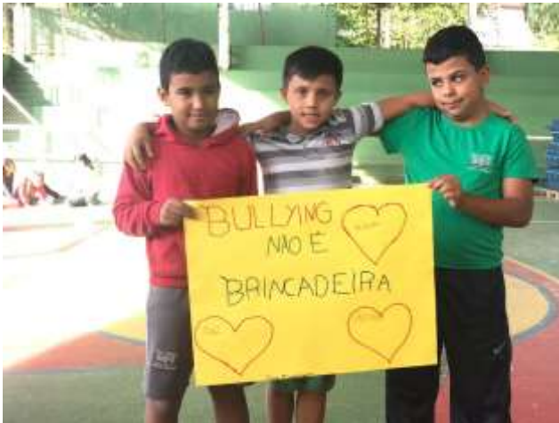
AÇÃO 2: Oficina com os alunos escolas municipais