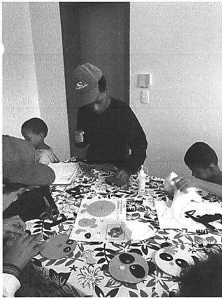
Oficinas de artesanato