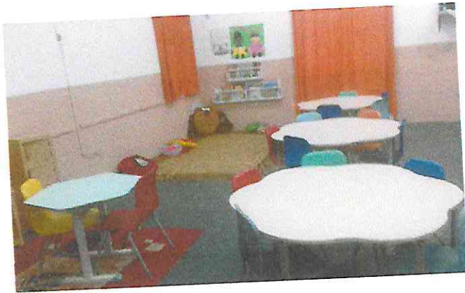
Foto dos cantinhos