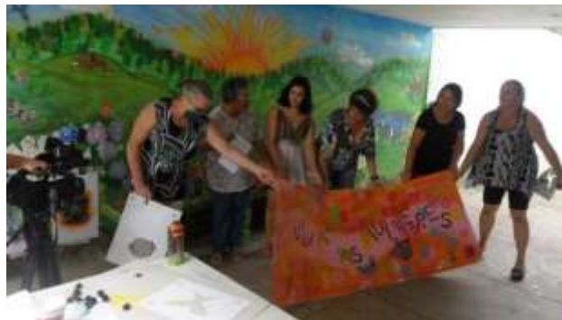
Oficina de grafite – CRAS portão (2016)