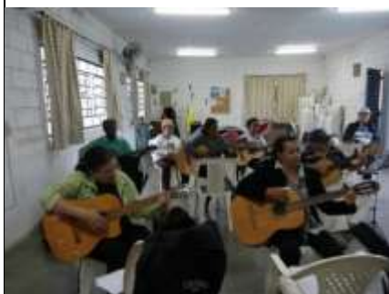
(Aula de violão – CCTI – 2017)

As profundas transformações no âmbito político-social, geradas pela mudança no perfil etário da nossa população, trazem muitos desafios para a sociedade, onde tudo deve ser repensado, com a perspectiva de uma revisão do papel social e da imagem do idoso, criando condições para libertá-lo do preconceito e da marginalização resgatando sua dignidade, propiciando-lhe boa qualidade de vida e convertendo as suas reivindicações em conquistas que possam preparar o caminho para um futuro melhor para todas as idades.