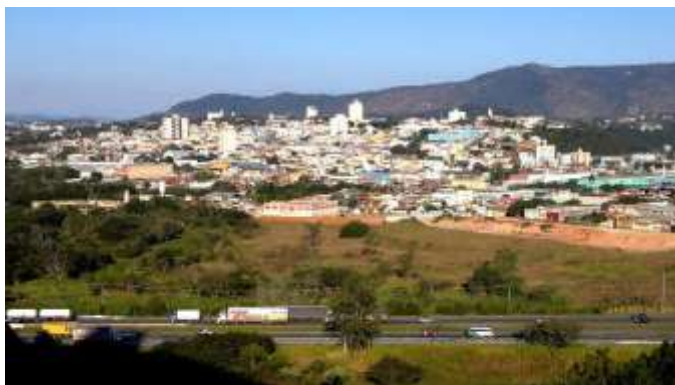
(Cruzamento de rodovias transforma Atibaia em um dos principais eixos logísticos do Estado)

A população atual de Atibaia é estimada em 138.500 habitantes, com mais de 26.000 cidadãos acima de 60 anos. Ainda que em contextos distintos, muitos bairros da cidade possuem em comum os traços da ocupação pouco ordenada, com loteamentos em sua maioria clandestinos, muitos realizados em áreas remanescentes rurais que foram a seu tempo engolidas pela cidade que se expandia, e ocupações de áreas invadidas, principalmente no eixo da antiga estrada de ferro. A região atraiu migrantes do sul de Minas Gerais, moradores da periferia de São Paulo e Guarulhos, e os oriundos da zona rural em declínio, principalmente, que buscavam alternativas mais econômicas de moradia e as oportunidades que começavam a surgir na região, com incremento da construção civil (turismo de segunda residência), a duplicação da Rodovia Fernão Dias e o processo de industrialização do eixo da Rodovia Dom Pedro e da região Bragança Paulista e mais recentemente Extrema (MG).