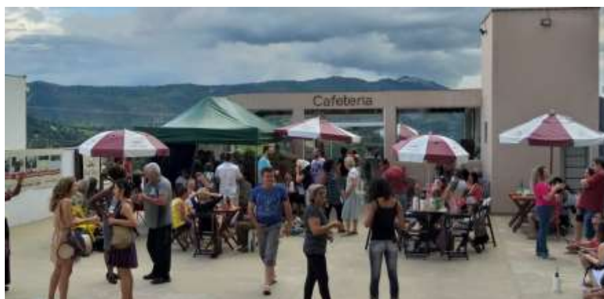
Café Dali é um empreendimento social gerador de receitas para a OSC, para além de funcionar como Ponto de Cultura e espaço de formação e qualificação profissional