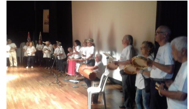
Coral percussivo da Terceira Idade se apresenta no Centro Cultural Victor Brecheret (2017)

Em 2020 tivemos o desafio de adaptar as atividades para formato on line de forma a não interromper o atendimento a usuários do CCTI – orientação de uso de celulares e computadores e rotinas de internet tornaram-se ação cotidiana dos educadores, com boa adesão dos idosos, apesar das dificuldades naturais com tecnologia!