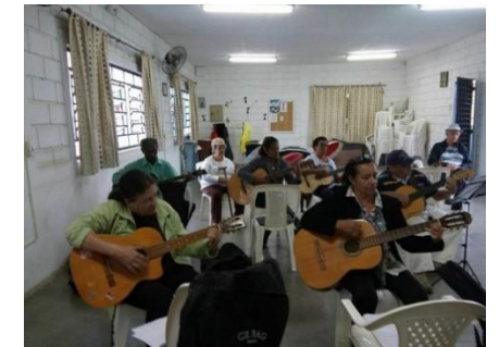
(Aula de violão – CCTI – 2017)

Este contexto de envelhecimento populacional vem demandando uma maior atenção das políticas públicas nos últimos 25 anos, mas ainda enfrenta estigmas do preconceito e do baixo investimento público para esta parcela cada vez mais significativa da população. O que se propõe como demanda emergente é a mudança cultural que reduz o significado de terceira idade a sinônimo de doença e inutilidade social.