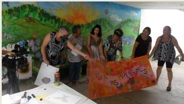
Oficina de grafite – CRAS portão (2016)

Desde 2015 operamos os Serviços de Convívio e Fortalecimento de Vínculos junto aos CRAS Caetetuba, Imperial e Portão, com população adulta e terceira idade – parceria SADS-PEA