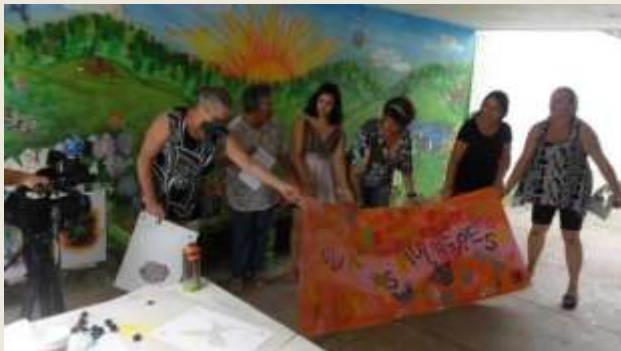
Oficina de grafite – CRAS portão (2016)

Desde 2015 operamos os Serviços de Convívio e Fortalecimento de Vínculos junto aos CRAS Caetetuba, Imperial e Portão, com população adulta e terceira idade – parceria SADS-PEA