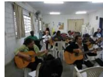
(Aula de violão – CCTI – 2017)

Este contexto de envelhecimento populacional vem demandando uma maior atenção das políticas públicas nos últimos 25 anos, mas ainda enfrenta estigmas do preconceito e do baixo investimento público para esta parcela cada vez mais significativa da população. O que se propõe como demanda emergente é a mudança cultural que reduz o significado de terceira idade a sinônimo de doença e inutilidade social.