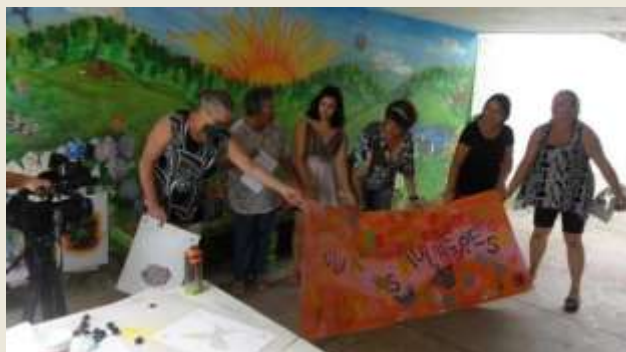
Oficina de grafite – CRAS portão (2016)

Desde 2015 operamos os Serviços de Convívio e Fortalecimento de Vínculos junto aos CRAS Caetetuba, Imperial e Portão, com população adulta e terceira idade – parceria SADS-PEA