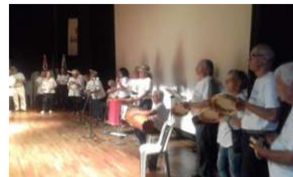
Coral percussivo da Terceira Idade se apresenta no Centro Cultural Victor Brecheret (2017)

Em 2020 tivemos o desafio de adaptar as atividades para formato on line de forma a não interromper o atendimento a usuários do CCTI – orientação de uso de celulares e computadores e rotinas de internet tornaram-se ação cotidiana dos educadores, com boa adesão dos idosos, apesar das dificuldades naturais com tecnologia!