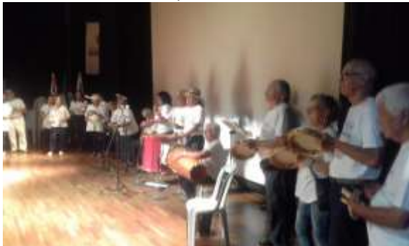
Coral percussivo da Terceira Idade se apresenta no Centro Cultural Victor Brecheret (2017)