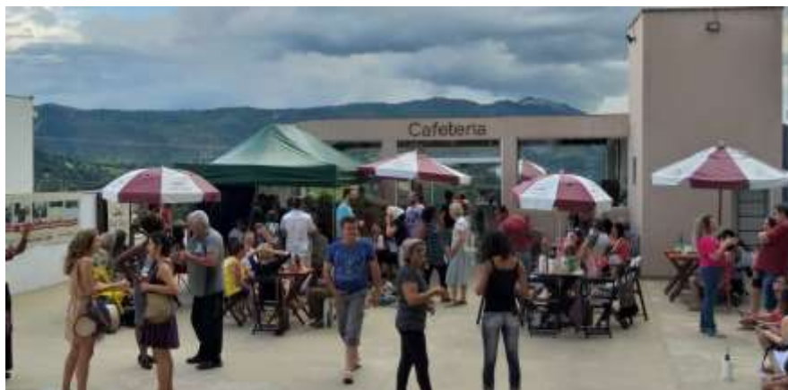
Café Dali é um empreendimento social gerador de receitas para a OSC, para além de funcionar como Ponto de Cultura e espaço de formação e qualificação profissional

– café-escola, salão-escola, oficina de economia criativa, espaço colaborativo e projeto Fortes.