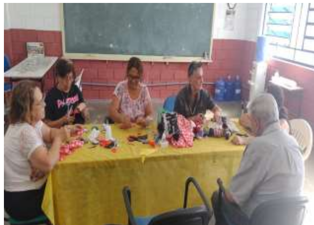
Dinâmicas da Alegria bairro Tanque