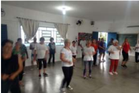
Universo Online- CCTI