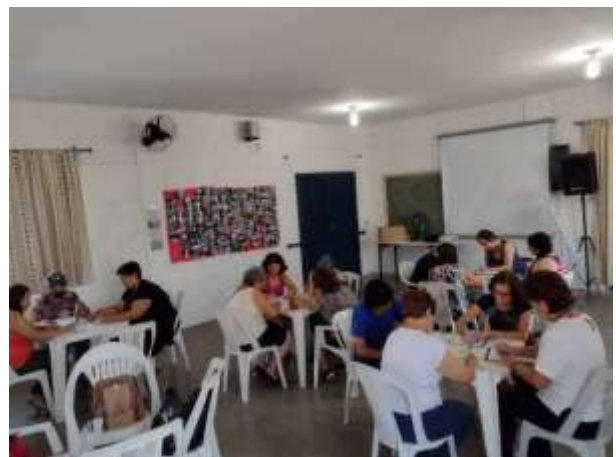
Ciranda Percussiva realizada em 24/03/2023 no Parque Zanoni