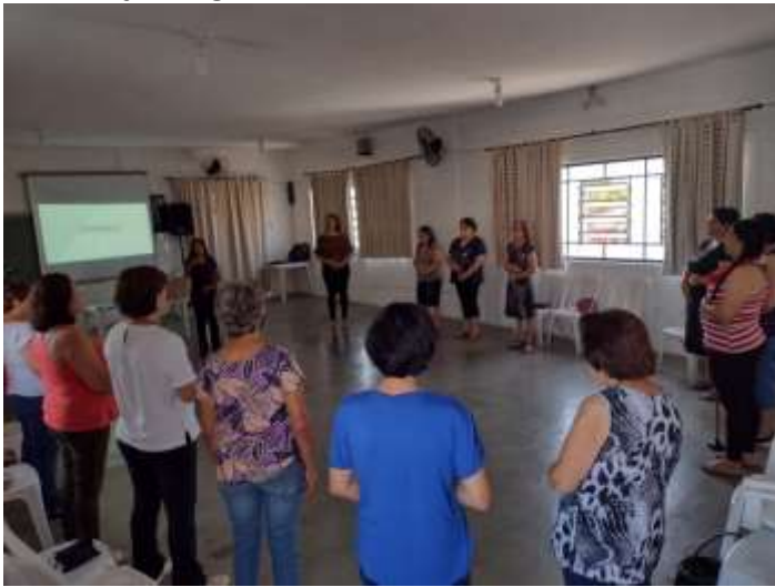
Roda de Conversa – Entendendo a Ansiedade CCTI