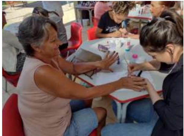
Mês das Mulheres- Palestra: “Lute como uma senhora” realizado no CCTI em 25/03/2023