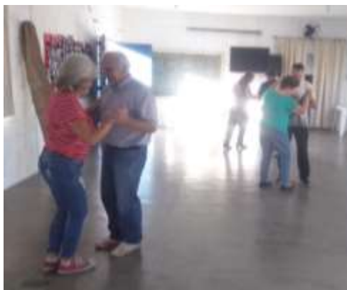
Dança e Alongamento bairro Tanque