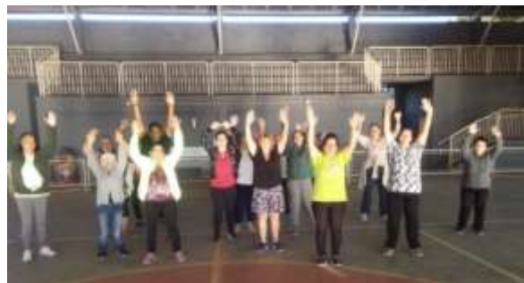
Coreografia - Centro esportivo do Atibaia Jardim