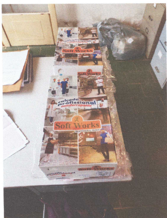
Figura 05: Caixas do Sapato crock