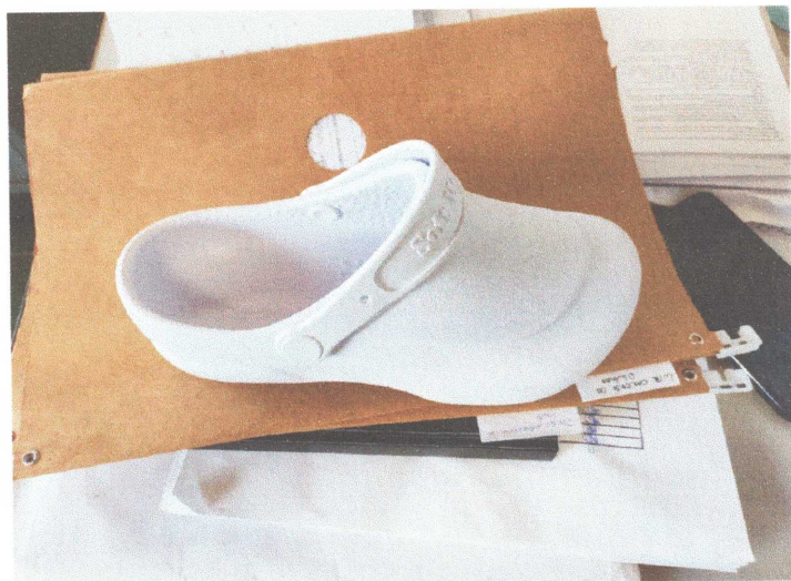
Figura 03: Sapato croc