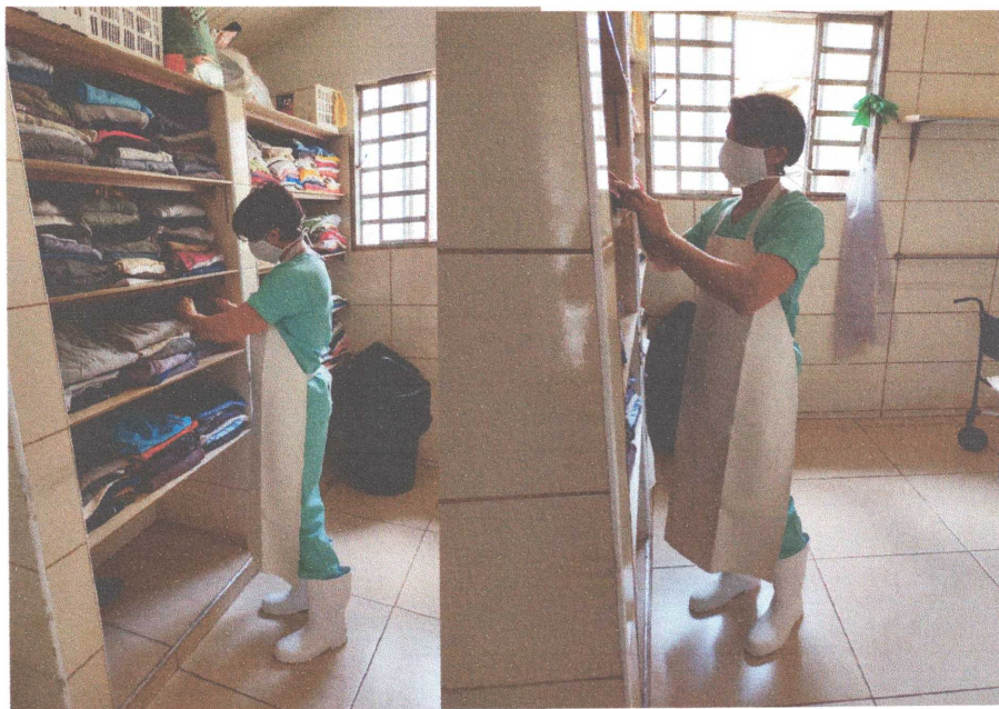
Figura 10: Funcionário fazendo uso dos EPI's adquiridos (Bota PVC, Avental PVC e mascarã TNT).

RUA ARARAS, 76 – FONE: (19) 3824-1962 – BAIRRO DOS FRANCOS – ÁGUAS DE LINDÓIA - SP