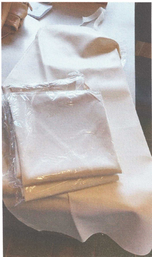
Figura 08: Avental PVC

RUA ARARAS, 76 – FONE: (19) 3824-1962 – BAIRRO DOS FRANCOS – ÁGUAS DE LINDÓIA - SP