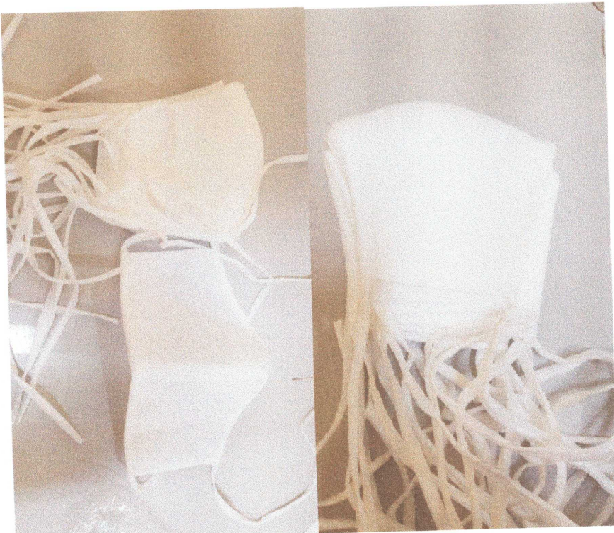
Figura 07: Mascaras TNT