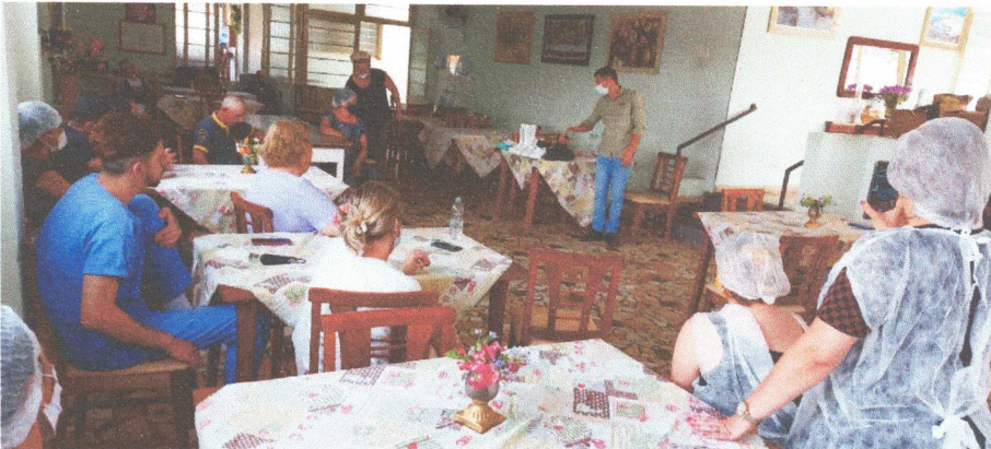
Figura 01: Treinamento oferecido aos funcionários para uso correto de EPI's

RUA ARARAS, 76 – FONE: (19) 3824-1962 – BAIRRO DOS FRANCOS – ÁGUAS DE LINDÓIA - SP