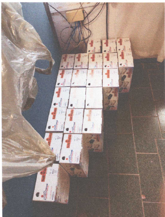
Figura 04: Caixas do Sapato crock

RUA ARARAS, 76 – FONE: (19) 3824-1962 – BAIRRO DOS FRANCOS – ÁGUAS DE LINDÓIA - SP