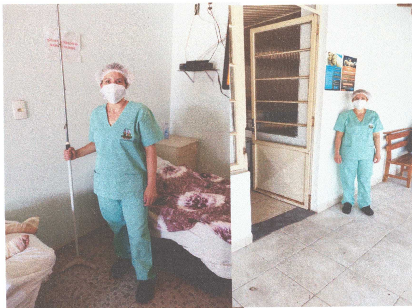
Figura 09: Funcionária fazendo uso dos EPI's adquiridos (Sapato Crock e mascarã TNT).