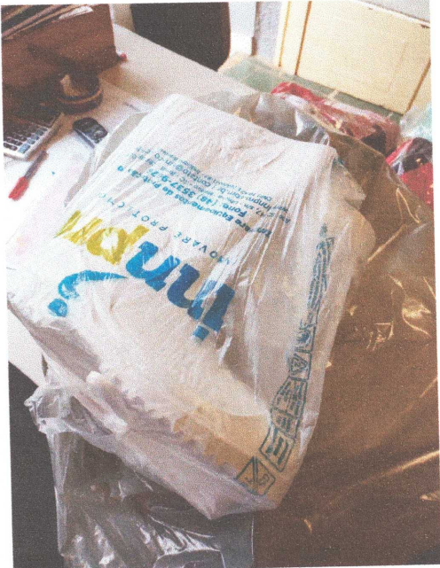
Figura 06: Bota PVC

RUA ARARAS, 76 – FONE: (19) 3824-1962 – BAIRRO DOS FRANCOS – ÁGUAS DE LINDÓIA - SP