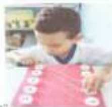
Apoio Pedagógico Pareamento "letras e números"