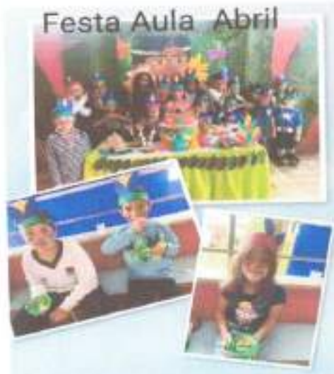
Festa Aula Abril