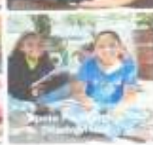
Apoio Pedagógico Jogo silábico