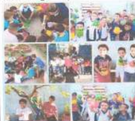
Vasos com garrafa pet