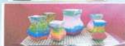
Oficina de reciclagem Vasos feitos com caixa de leite