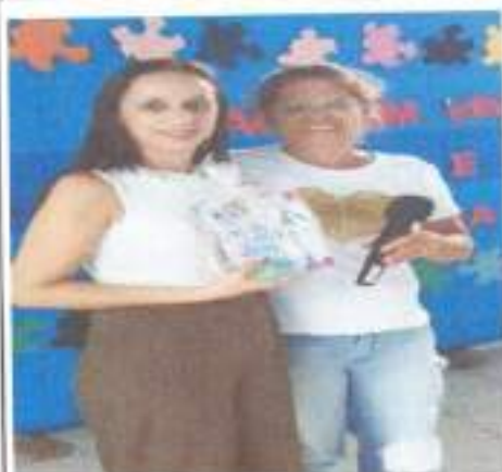
Reunião de Pais

Serviço de convivência e Fortalecimento de Vínculos, Proteção Social Básica