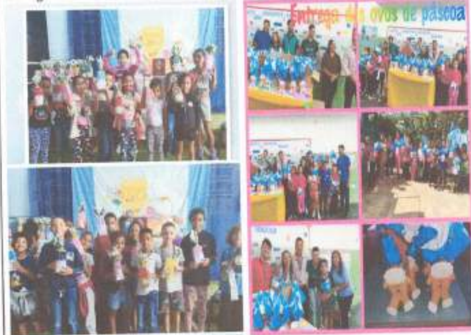
Entrega dos Ovos de Páscoa

Serviço de convivência e Fortalecimento de Vínculos, Proteção Social Básica