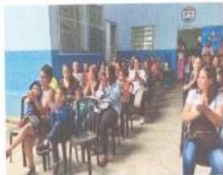
Início das atividades- Dinâmicas de acolhida