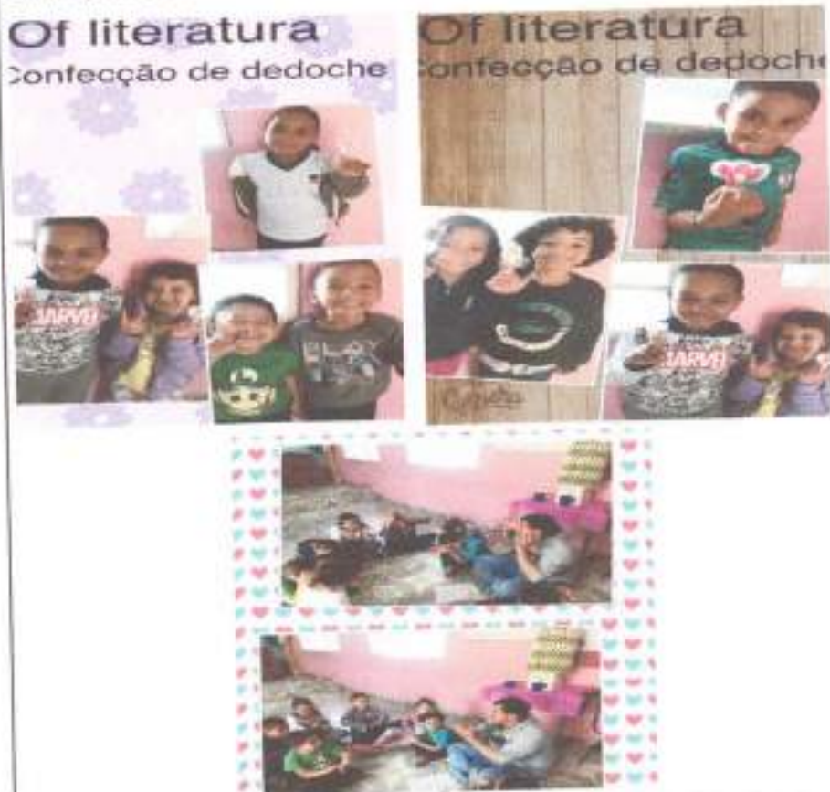
Confecção de dedochê

Rua Jose Longo, 148 – Sagrado Coração – Jandira / SP CEP 06608-340.