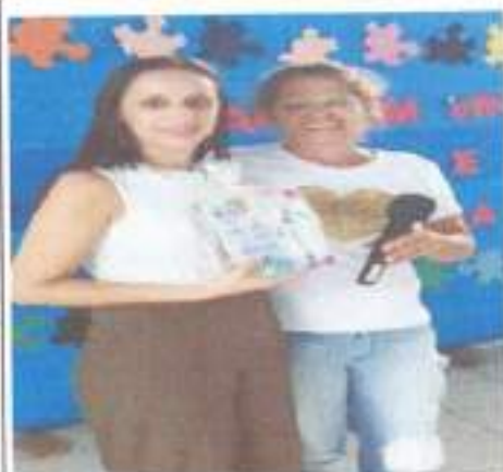
Reunião de Pais

Serviço de convivência e Fortalecimento de Vínculos, Proteção Social Básica