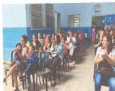
Início das atividades- Dinâmicas de acolhida

Rua Jose Longo, 148 – Sagrado Coração – Jandira / SP CEP 06608-340. Tel.: 11 4789-5302 - CNPJ 51.245.470/0001-56 www.caritasfrancisco.org.br / e-mail: soccaritas@uol.com.br