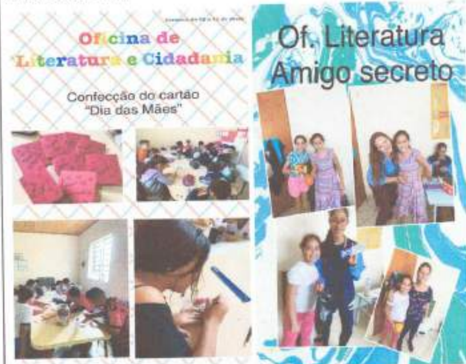
Brincadeira: Amigo secreto